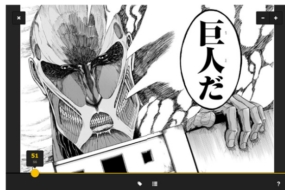
「進撃の巨人 attack on titan」(C) 諫山創/講談社