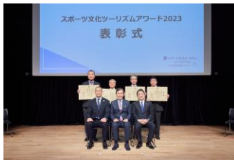
表彰式の様子（特別賞）