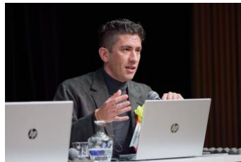
4省庁連携セミナーの様子(ブラッドショー氏)

〈本資料に関する報道関係者様からのお問い合わせ先〉「第7回スポーツ文化ツーリズムシンポジウム」運営事務局