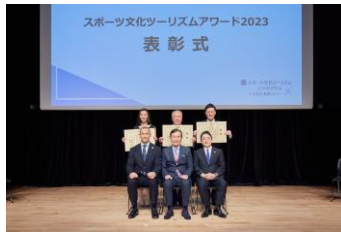
表彰式の様子（本賞）