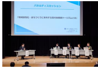
4省庁連携セミナーの様子

表彰式を含めたイベント「第7回スポーツ文化ツーリズムシンポジウム&4省庁連携セミナー」は、国内の多彩な有識者をゲストに迎え、スポーツ×文化×観光による新たな地域振興と、インバウンド活性化施策を考えるイベントです。第7回目開催となる今年度は、表彰式のほか、3庁長官によるトークセッションや「スポーツ文化ツーリズムの最前線」をテーマにした「基調講演」。環境省、スポーツ庁、文化庁、観光庁による「4省庁連携セミナー」も同時開催し、今後の地域活性化に欠かせない活動の端緒を開きました。