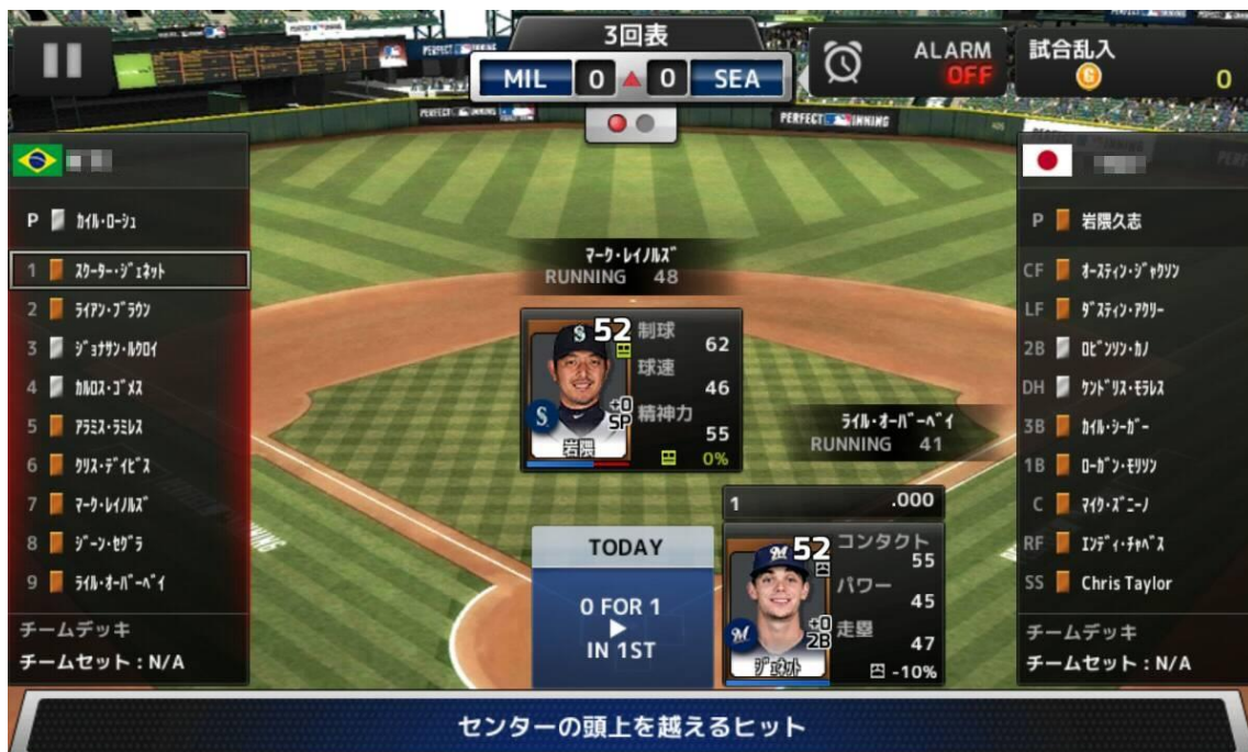
〈マニュアルとオートプレイ画面〉