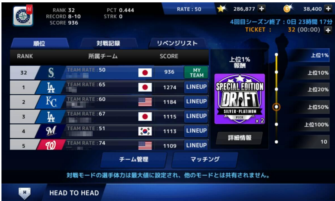
〈対戦モードのマッチングとランキング画面〉