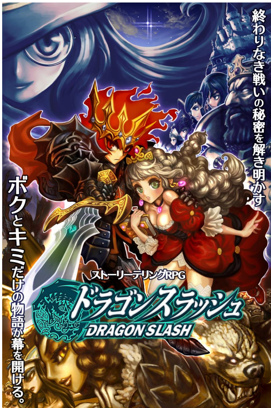
〈ドラゴンスラッシュ ポスター〉

『ドラゴンスラッシュ』は、まるで絵本のように美しく描かれたファンタジーな世界で繰り広げられる壮大な物語です。プレイヤーは、魅力溢れる5つのジョブの中から好きなキャラクターを選び冒険へと旅立ちます。冒険の途中、強力なモンスターを撃退したり、冒険の友「仲間」と出会ったり、他のプレイヤーとも協力しながら成長していきます。RPG ならではの充実したストーリーを用いることで、次へ次へと物語を進めたい、 「ストーリーテリング RPG」になっております。