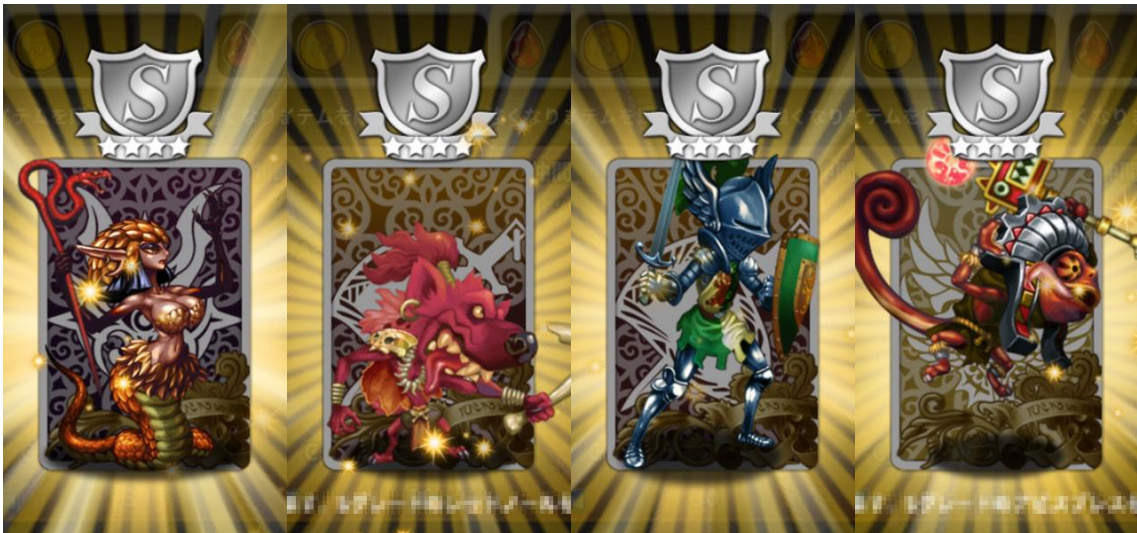
〈Sグレード仲間の一例〉