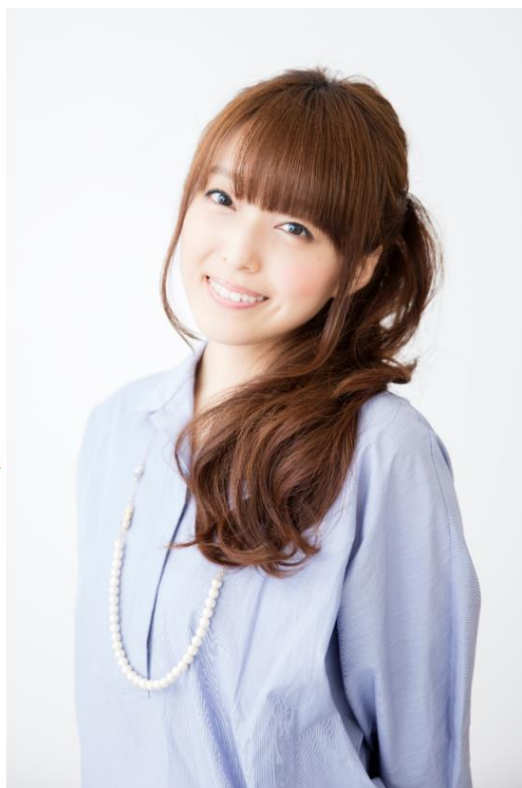
○アメリン 【CV:加藤 英美里】 <代表作> ・魔法少女まどか☆マギカ(キュウベえ) ・化物語/偽物語(八九寺真宵) ・オーバーロード(アウラ・ベラ・フィオーラ) ・らき☆すた(柊かがみ)