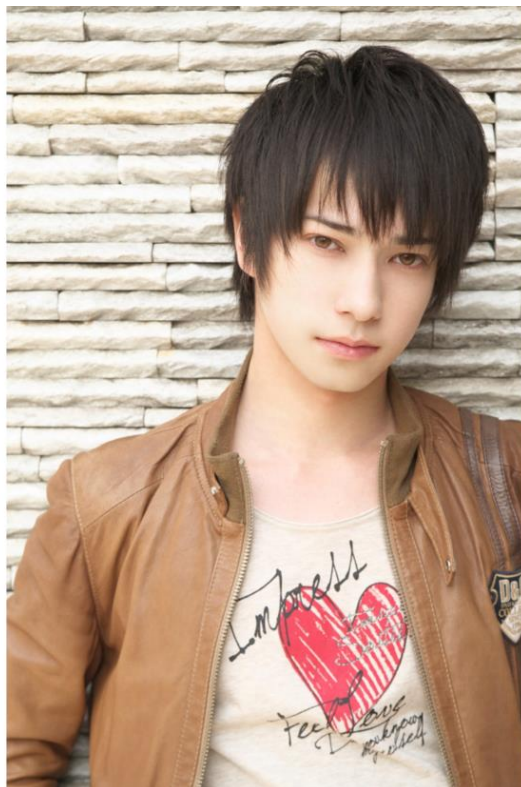
○ルシアン 【CV:ランズベリー・アーサー】 <代表作> ・スタミュシリーズ(月皇海斗) ・ハイキュー!!(渡親治) ・アイカツスターズ!(吉良かなた) ・政宗くんのリベンジ(山田茂雄)