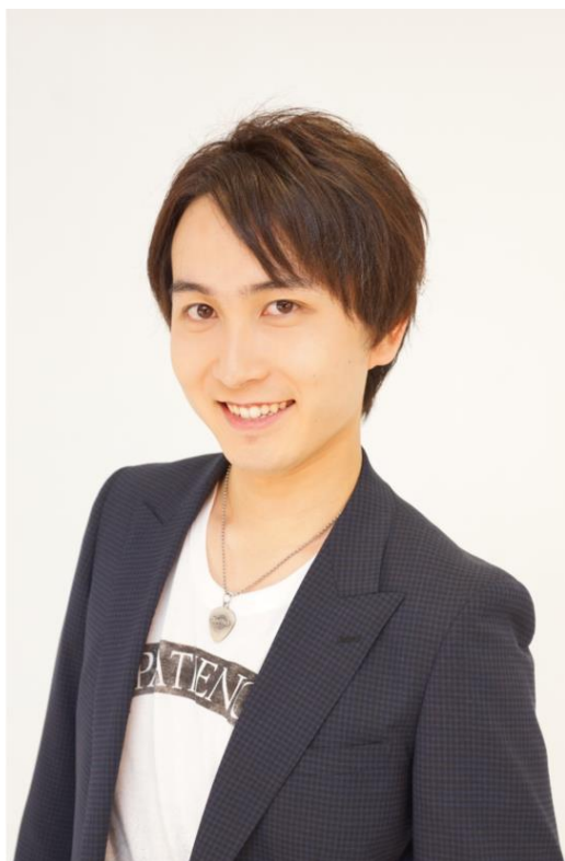
○フィン 【CV:中島ヨシキ】 <代表作> ・ヒナまつり(新田義史) ・アイドルマスター SideM(山下次郎) ・戦刻ナイトブラッド(山県昌景) ・DYNAMIC CHORD(青井裕樹)