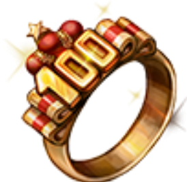
100 日のメモリアルリング