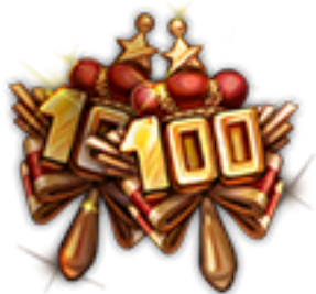
100 日のメモリアルピアス

・配信 100 日目を記念して製作したアクセサリをプレゼントいたします！ ※上記期間中、ログインすると郵便箱に届きます※1アカウントごとに1回のみ受け取れます。