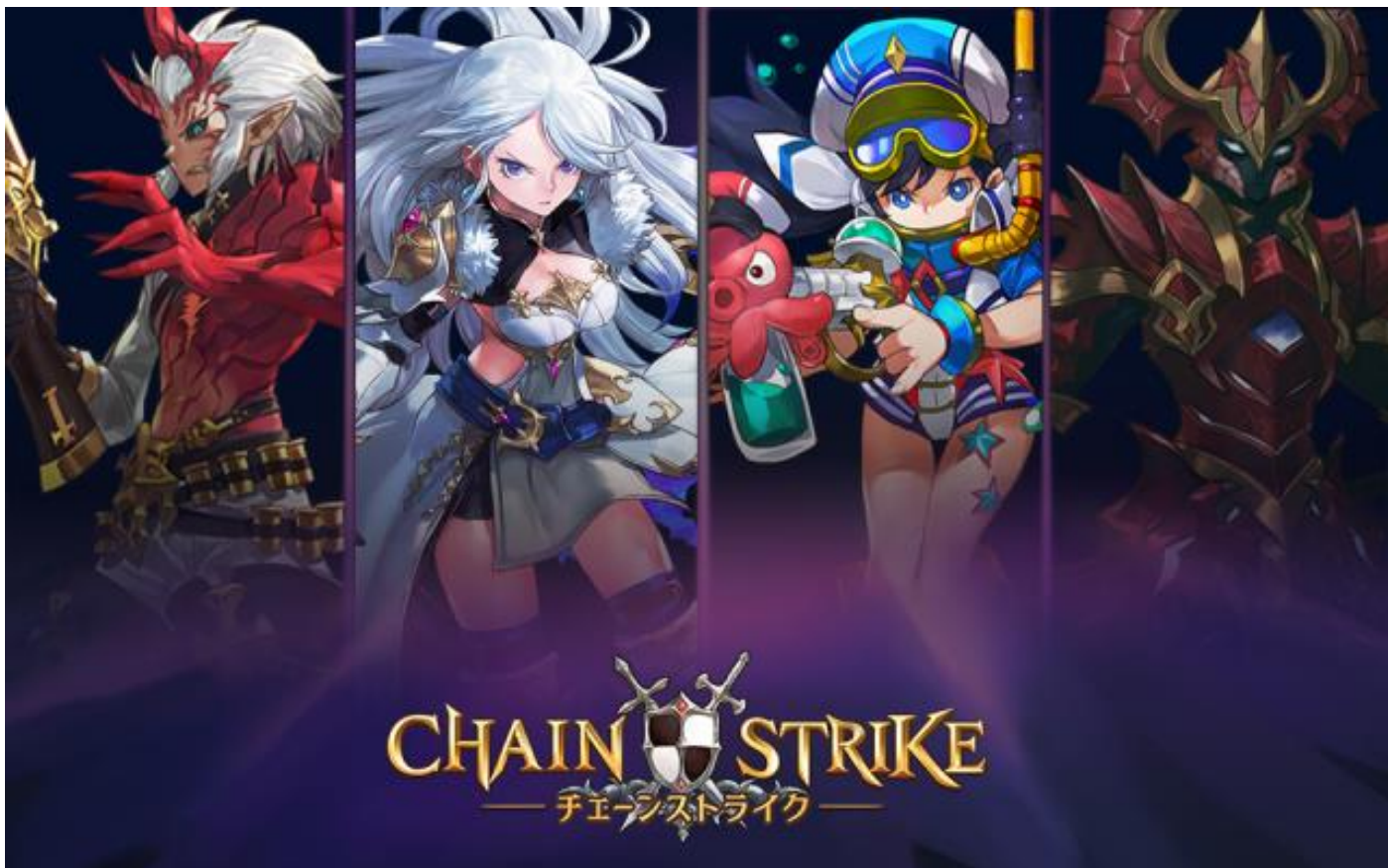
▲左からファウスト、ターナ、マリー、ドラグナス

「ファウスト」は信仰高き神の戦士ですが、片腕が悪魔によって浸食され、飲み込まれないように日々戦っています。「ターナ」は、優等生で率先してリーダーシップを発揮しチームをまとめる存在です。「マリー」は責任感と探求心が強い女の子、海軍を最年少で入隊し将来有望な海の戦士です。「ドラグナス」はドラゴンスレイヤーとして無類の強さを誇ります。