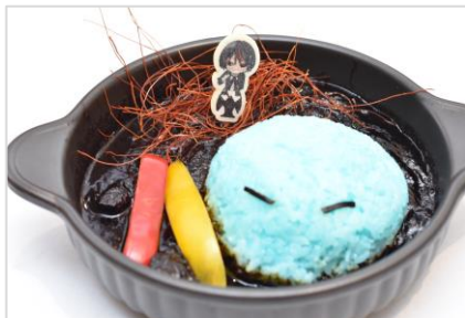
【リムルとディアブロの黒カレー】