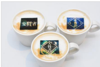
【ユニークスキル・ラテ】