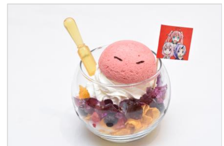
【スイーツ同盟のパフェ】