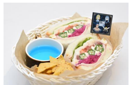
【オクタグラム・サンドイッチ】

8種の具材を挟んだサンドイッチ、スーブ、トルティアチップスのバスケット。フラッグ付。