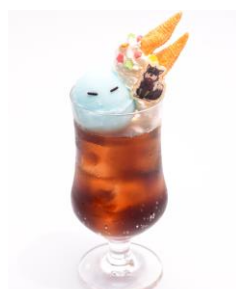
【リムルとランガのクリームソーダ】