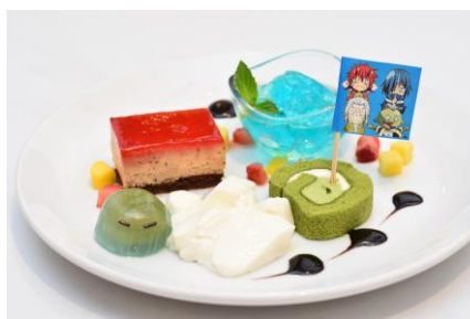
【ハクロウと弟子のデザートプレート】

パンナコッタ、ラズベリーと紅茶のムース、ブルーハワイゼリー、抹茶ロールケーキ、水まんじゅうのプレート。フラッグ付。