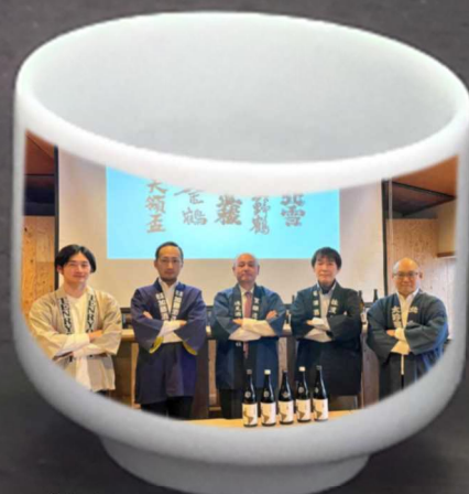
佐渡5歳の蔵元 または蔵人が乗車 蔵と銘柄をご紹介します！