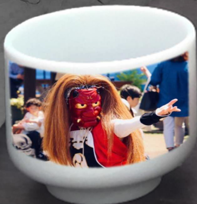
車内での 鬼太鼓の演舞