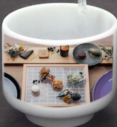
“燕三条 Bit” による 新潟の旬の食材を 使った料理・スイーツ