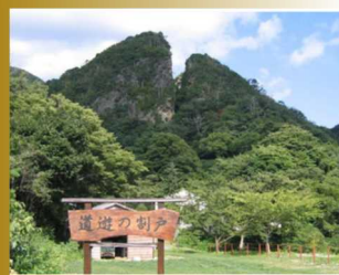
佐渡金山「道遊の割戸」