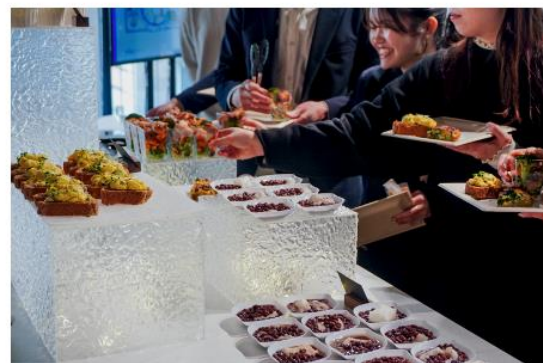
COSORI製品で調理した料理を実食