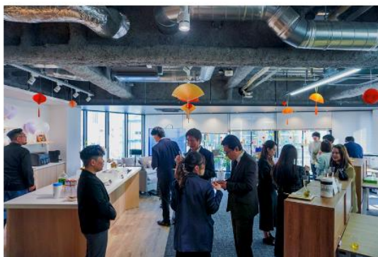
移転記念パーティーの様子