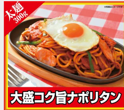
大盛コク旨ナポリタン