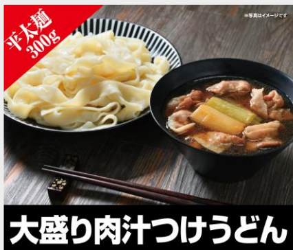
大盛り肉汁つけうどん