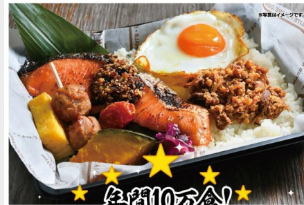
ゴマ醤油サーモン弁当