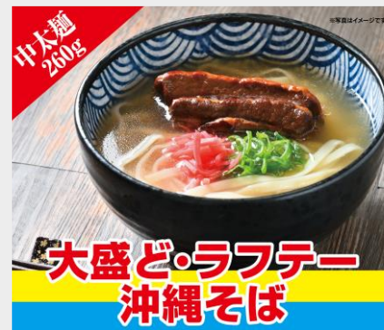
大盛ど・ラフテー 沖縄そば