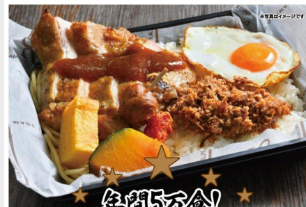
グリルチキン弁当