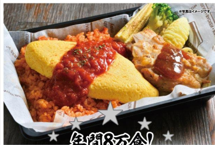
大人のオムライス