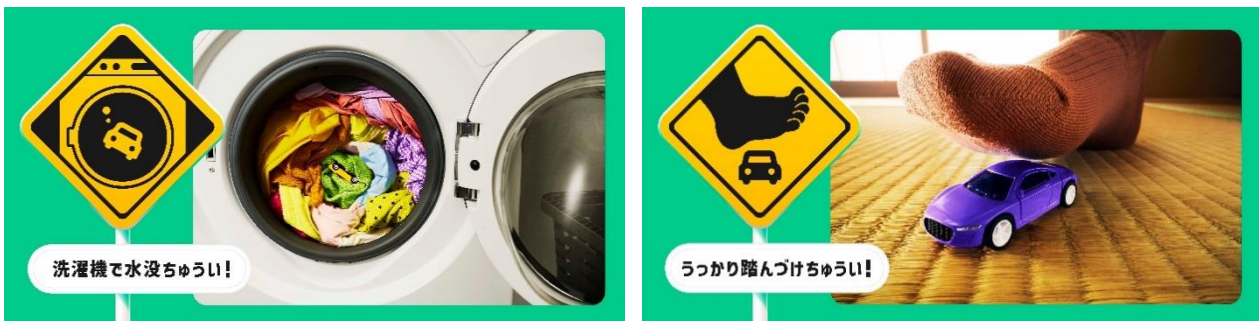
アクシデント事例イメージ

本施策は、WEBサイトとSNS上で展開します。WEBサイトやSNSで、ミニカーに起こったアクシデントを募集し、アクシデントを類型化したり、ドライバーとなるお子さんの性格などを分析したりすることで、どうすればミニカーのアクシデントを無くすことができるかを考えていきます。また、アクシデントの類型には実際の交通標識を模したデザインをアレンジしたオリジナルの注意標識を開発し、普段の生活で目にする標識について、気づきを得るきっかけを提供していきます。募集したアクシデント事例と、分析結果は2025年3月27日にプロジェクトWEBサイトに掲載します。