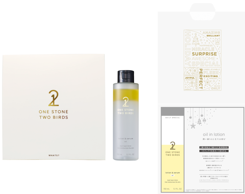
右画像はイメージ

本企画では、ONE STONE TWO BIRDS公式アカウントをフォロー & キャンペーンの投稿をいいね & RTした後、乾燥悩みをコメントしていただいた方の中から抽選で20名様に新商品「オイルインローション」が入ったクリスマスギフトボックスをプレゼントいたします。