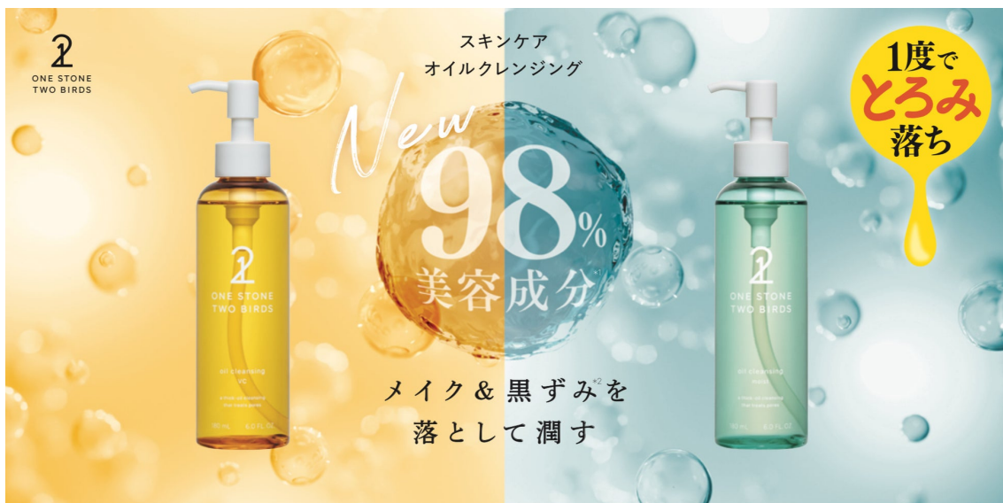
新発想の「スキンケアオイルクレンジングクレンジング」

美容ブランド「ONE STONE TWO BIRDS」を手がけるb&w株式会社は、2023年秋の新作スキンケアとして、メイク&黒ずみ*2を1度でとろみ落ちさせる新発想の潤うメイク落とし「スキンケアオイルクレンジング」を発売いたします。