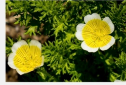
メドウフォーム油 2

他の植物油と比較してややとろみが強く、肌に厚みのある潤いの膜を作り、伸びが良いテクスチャーに。