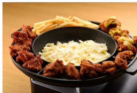
「UFO チキン」の3種類の味付けのチキンは、そのまま食べてもチーズに絡めてもよし (2,480 円/税込) ※2~3人前

上記の看板メニューのほかにも、トッポギやキンパなどの一般的な韓国料理や、鉄鍋料理も提供しており、各テーブルのコンロで温めながら熱々で食べることができます。ドリンクも韓国酒が豊富にあり、特にフルーツ入りの「チャミスルソー」はスッキリとした味わいで男性でも女性でも飲みやすい人気メニューです。そして、映えデザートの「マンゴーバナナ・ストロベリーバナナ」はフルーツが沢山入っており、さっぱりとした味わいになっています。