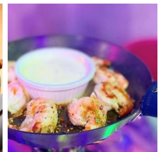
プリプリのエビは食べ応えバツチリ。秘伝のタレをかけた「鉄鍋エビロール」 (980 円/税込)