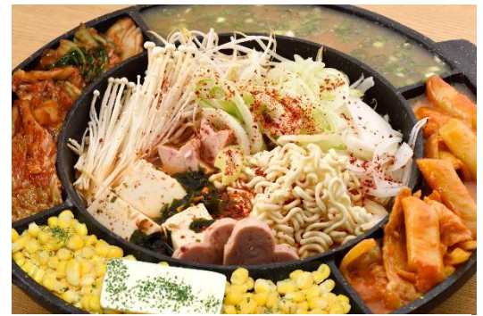
特製スープのチゲ鍋「BAEL 鍋」。その日の仕込みでまわりの具材が変わります (1,800 円/税込) ※2人前から

「UFO チキン」は3種類の味付けのチキンをトロトロのチーズに絡めていただくメニューで、チキンをそのまま食べても満足できる一品です。そして「鉄鍋エビロール」は、秘伝のタレをかけた豚肉を巻き付けたエビにチーズを絡めて食べる一品で、プレオープンから大人気のメニューです。