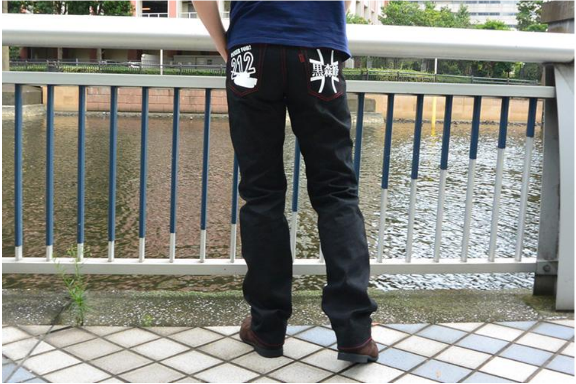
バックスタイルもワイルドに決まります (モデル身長177cm 体重70kg 32インチ着用)