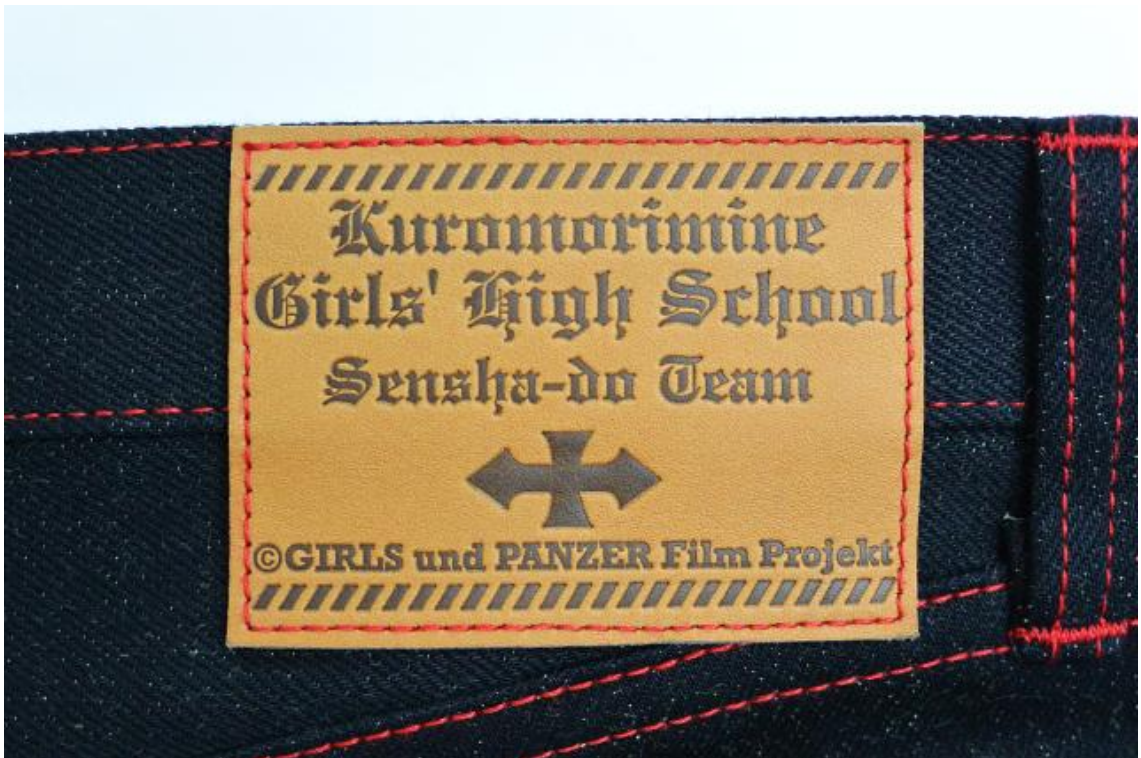
オリジナルの牛革パッチ