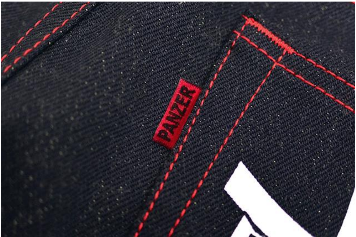
高級感ある織りピスネーム