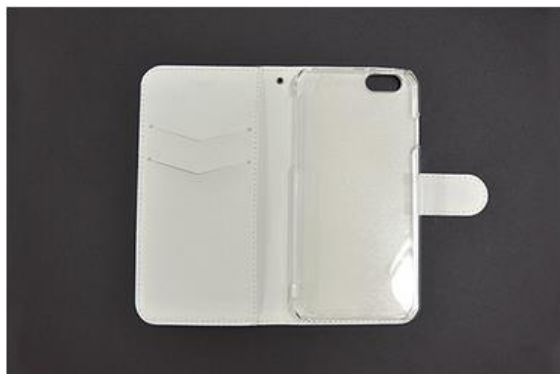
ベルトはマグネット式です