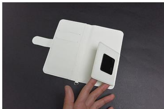
汎用タイプは粘着シートで固定