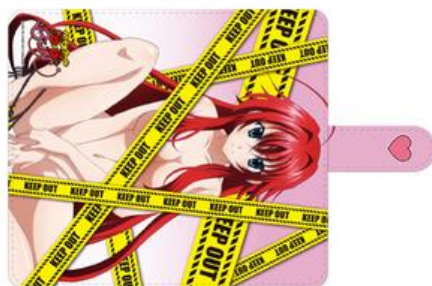
汎用タイプデザインイメージ