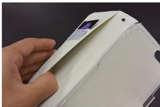
内側にもポケットがあります