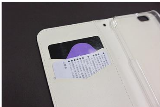
便利なカード入れ