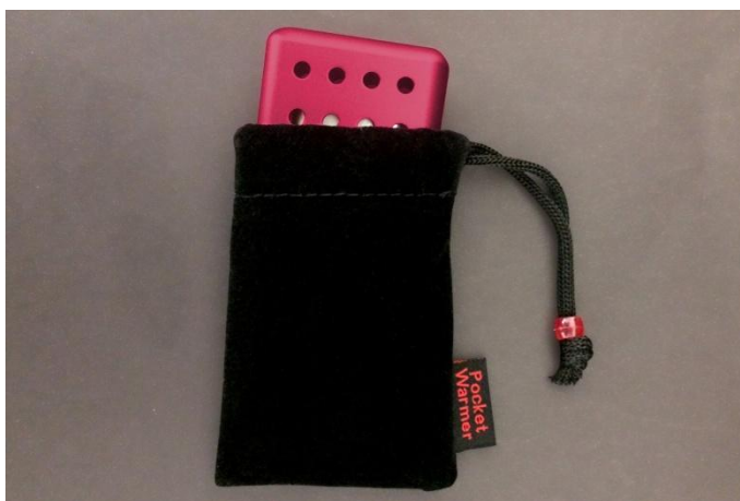
専用袋に入れてご使用ください