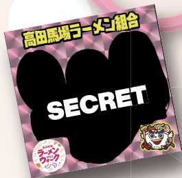
限定デザインシール(キラ)

発酵そみファを購入して、5つのお店 をまわって合計6つのスタンプが集 まったら、なるべく早めに麺屋宗でキ ラシールに引き換えちゃいましょう。 スタンプカードに記載されている注 意事項をチェックしてぜひラーメン ウォークを楽しんで欲しいです☆