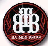
高田馬場ラーメン組合

発酵そみファを購入して、5つのお店 をまわって合計6つのスタンプが集 まったら、なるべく早めに麺屋宗でキ ラシールに引き換えちゃいましょう。 スタンプカードに記載されている注 意事項をチェックしてぜひラーメン ウォークを楽しんで欲しいです☆