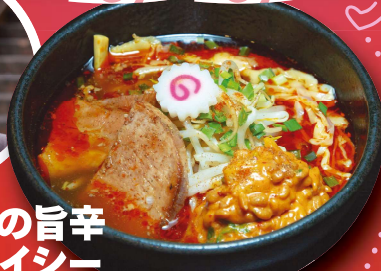
至福の旨辛 スパイシー キムチ納豆麺