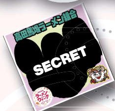
限定デザインシール(ノーマル)