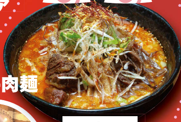
そみファ麻辛牛肉麺