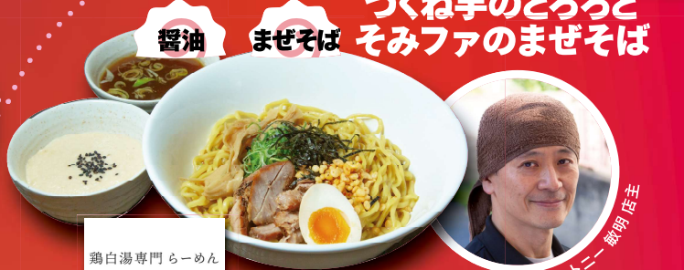
醤油 まぜそば つくね芋のとろろと そみファのまぜそば