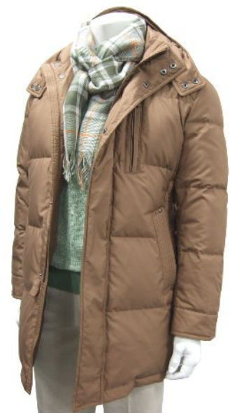
「ザ・スコッチハウス」の花粉対策機能を付加した「京鴨ダウン」