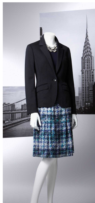
婦人服「ポール・スチュアート」 “抗ウイルス機能”を持つジャケット

今回発売を開始した“抗ウイルス機能”を持つ商品は、テーラードジャケット、ノーカラージャケット、スカート、パンツの計4型で、繊維上に固定化されている抗