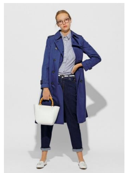
婦人服「マッキントッシュ フィロソフィー」 ウールライナー付きの「花粉プロテクトコート」