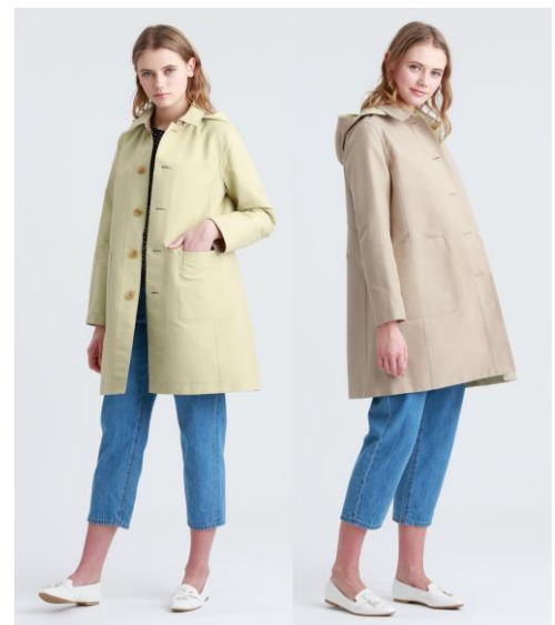
「マッキントッシュ フィロソフィー」ウィメンズ 2色楽しめるリバーシブル仕様の「花粉プロテクトコート」