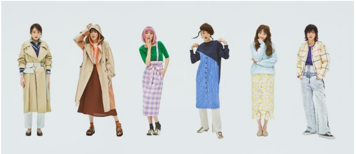
女優の飯豊まりえさんをモデルに起用し、18変化する2020春夏ビジュアル (第一弾)

※フェイスフィルター：Instagramのストーリーの投稿画面で好きなフィルターを選んで顔を認識すると、顔に合わせてさまざまなアクションを起こすというもの。芸能人やフェイスフィルターアーティストが作るオリジナルのフィルターが最近注目されている