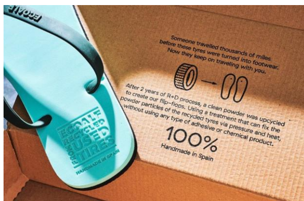
環境保全を伝えるプロダクトとパッケージ