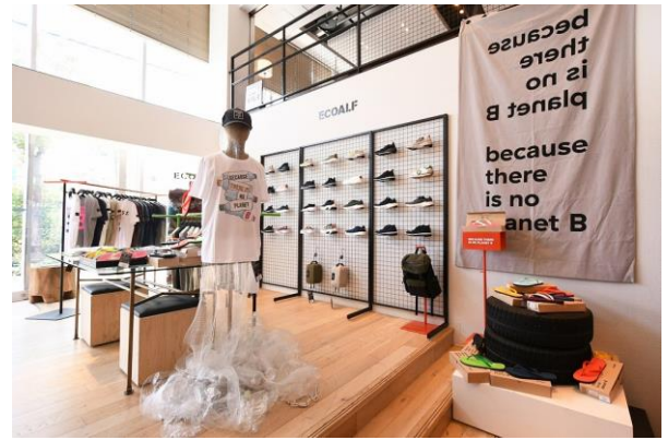
ECOALF 「湘南 T-SITE」ポップアップストア (9月6日まで開催中)