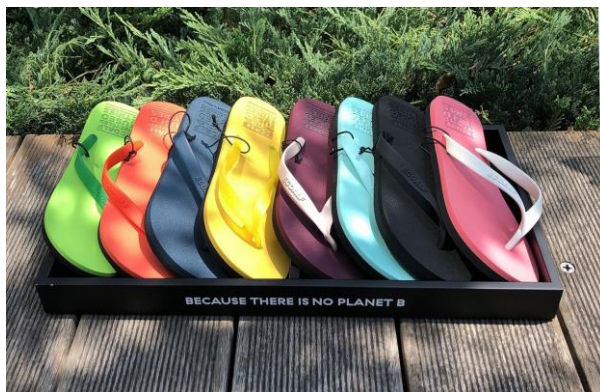
カラフルな 11 色展開