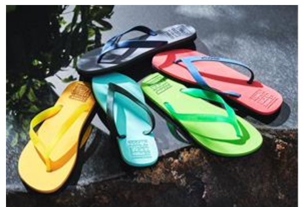
「ECOALF タイヤビーチサンダル」

「ECOALF」は、すべてのアイテムを再生素材や環境負荷の低い天然素材のみで製造し販売するスペイン生まれのサステナブルファッションブランドです。ファッション産業が世界の天然資源を大量に使い続ける中で、ペットボトル、タイヤ、漁網などを独自の技術でリサイクルしてこれまで300種類以上もの生地を開発し、新たなコレクションをつくり出しています。また、海洋ゴミを回収・分別・再生し、製品としての新たな命を与えるプロジェクト「UPCYCLING THE OCEANS(UTO)」(アップサイクリング ジ オーシャンズ)を推進するなど、“地球環境を守るために服をつくる”という新しい発想のエコサイクル型ファッションブランドです。