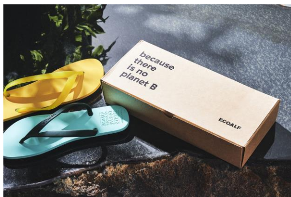
夏のプレゼントにも最適