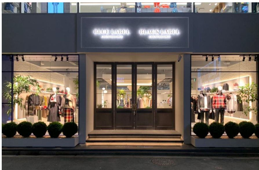
「ブルーレーベル/ブラックレーベル・クレストブリッジ 原宿本店」外観

ブランドとお客さまが双方向でコミュニケーションが取れるオンライン接客サービスを取り入れるなど、ECとリアル店舗を融合した新たな買い物体験を提案し、生活スタイルに応じてご利用いただけるストアとしてブランドの世界観を発信していきます。