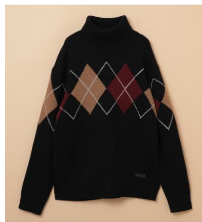
ブランドECサイト限定商品 一例

写真) 左/中：「BLUE LABEL CRESTBRIDGE」 右：「BLACK LABEL CRESTBRIDGE」