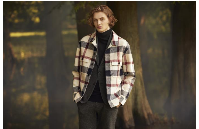
2020年秋冬「BLACK LABEL CRESTBRIDGE」