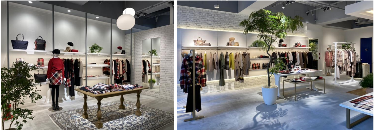
「ブルーレーベル/ブラックレーベル・クレストブリッジ 原宿本店」内観

店舗デザインは、ロンドンのホテルレセプションにいるような“くつろぎ”を感じていただける空間をイメージしており、英国の伝統様式のなかにコンテンポラリーな要素を加え、ブランドらしさを表現しています。店舗ファサードには、ロンドンのホテルにあるようなトピアリー（植物の造形物）を設置し店内にも植栽を多く配することで、お客さまに安らいでいただける空間づくりをしています。また、アンティーク調の什器とペルシャ絨毯を用い英国の格式を表現しながら、メタル素材を使用した洗練されたデザインの什器を使いコンテンポラリーな要素をミックスさせることで、ブランドの世界観を表現しています。