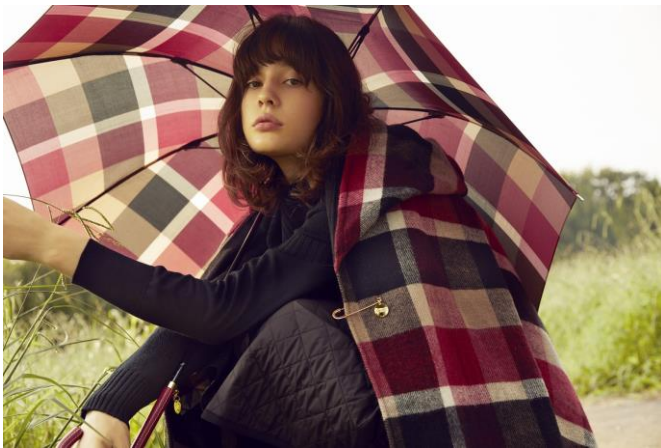
2020年秋冬「BLUE LABEL CRESTBRIDGE」