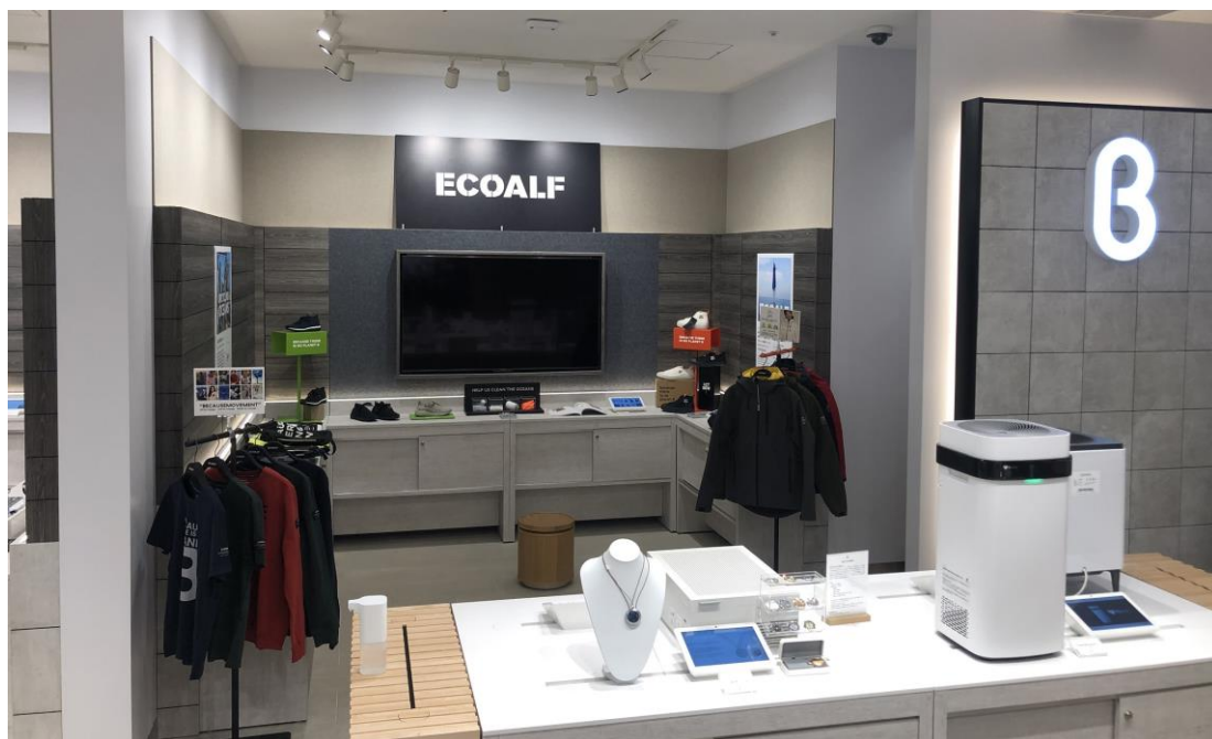
b8ta Tokyo – Shinjuku Marui の「ECOALF」展示エリア

る製品ができるまでのストーリーをご覧いただき、“地球環境を守るために服をつくる”という発想の「ECOALF」のフィロソフィーを知っていただくためのスペースとなっています。