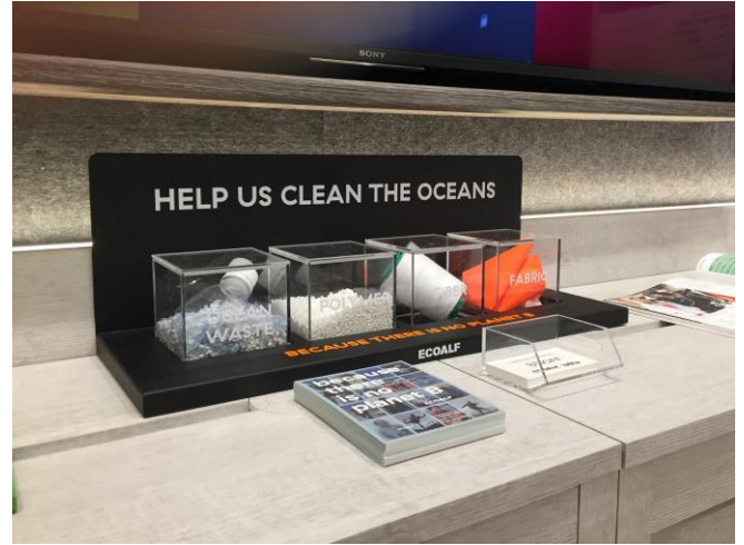
ペットボトルがリサイクルされる工程を表したディスプレイ