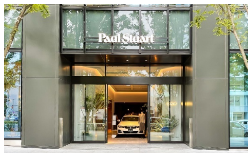
Paul Stuart 青山本店

■ショップコンセプト : “New One , Only One , Classic & Modern ”をキーワードに、「ポール・スチュアート」の伝統と革新を伝える“何処にもない此処だけのPaul Stuart ”をコンセプトとし、日本で初となる本格的な Bar を併設した、世界中から選りすぐりのファッションを集めるスペシャリティストア