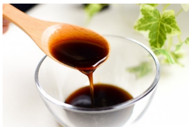
「幸せの黒糖蜜」 1,540円 (税込)

なお、「オーガニック抹茶&黒糖蜜」に使用している「宮古島未来物語」の「幸せの黒糖蜜」は、9月30日(木)までの期間中、Bar 「The COPPER ROOM (ザ コッパー ルーム)」にて販売しております。