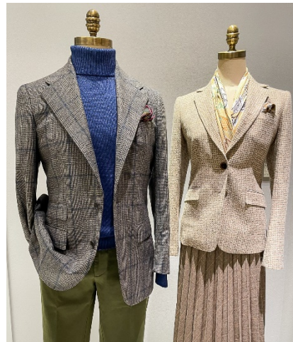
地球環境に特化したテキスタイル・ライン 「H.O.P.E」を使用したオーダージャケット