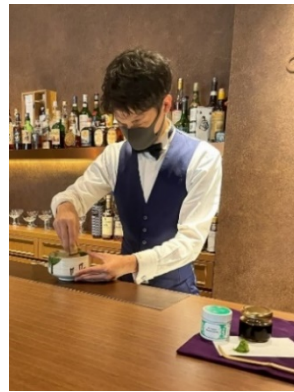
「オーガニック抹茶&黒糖蜜」は、バーテンダーがその場で抹茶を点てて提供。