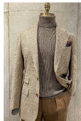
「H.O.P.E」の「レッドエリシルク」を使用したオーダージャケット。

“VBC”公式サイト https://vitalebarberiscanonico.jp/