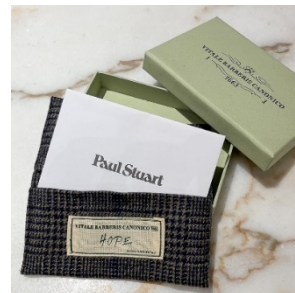
「H.O.P.E」のタグが縫い付けられたオリジナルカードケース。