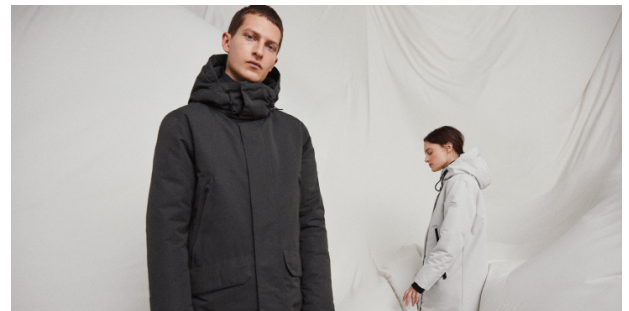
2021年秋冬「ECOALF」ビジュアル

■Facebook https://www.facebook.com/ecoalfjapan/