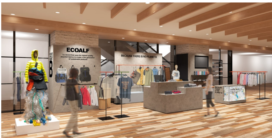
「ECOALF 梅田阪神」店舗イメージ

また、オープニングイベントとして「ACT NOW! ～未来のための FASHION×CREATION～」をテーマに「ECOALF」の活動に賛同する若手活動家・アーティストらと協業し、店内8階に設けられた160坪の大規模催事場において、10月8日(金)～11日(月)の4日間にわたり環境問題と向き合う展示やワークイベントを開催し、サステナブルに繋がる環境や心身の豊かさについて発信いたします。