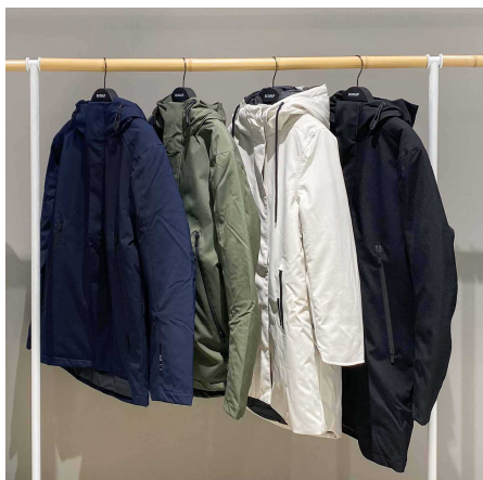
ジャケット、コート