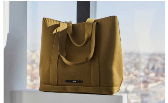
海洋ペットボトルからつくった「UTO シリーズ」新作のバッグ

「ECOALF」は、ハビエル・ゴジエナーチェが自身の子どもが生まれたことを機に次の世代に残すべき世界について考え 2009 年にスペインで立ち上げられたサステナブルファッションブランドです。 Because there is no planet B”（第2の地球はないのだから）をスローガンに、すべてのアイテムを再生素材や環境負荷の低い天然素材のみで製造し販売しています。ファッション産業が世界で2番目に環境を汚染している産業と言われる中で、ペットボトル、タイヤ、漁網などを独自の技術でリサイクルしてこれまで400種類以上もの生地を開発し新たな製品をつくり出しています。