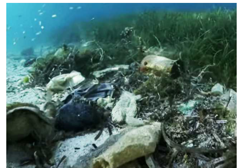
海底に沈むプラスチックごみ

「UPCYCLING THE OCEANS」とは、海洋ゴミの回収とリサイクル素材活用推進のためにスペイン ECOALF 社と ECOALF 財団が 2015 年からスペインを拠点にはじめたプロジェクトです。地中海の多くの漁師・漁業組合の方々の協力により、漁業で引き上げられた海洋ゴミからペットボトルを回収・分別・再生し、繊維に変え新たな製品をつくりだしています。2020 年には地中海の 40 以上の港で約 3000 人（2015 年からの累計では 10000 人以上）の漁師の方々の協力を得て、2015 年から 2020 年までで累計約 600 トンもの海洋ゴミを回収してきました。2020 年から 2021 年にかけては新たにイタリア及びギリシャの港も加わり、現在「UTO SPAIN」は地中海全域の港を網羅した活動となっています。2017 年にはタイ政府にも認められ、タイ官公庁と共に「UTO THAILAND」を推進しています。