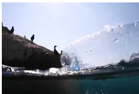
海洋ペットボトル

「UTOシリーズ」は、海洋ゴミを回収し新たな製品に生まれ変わらせるプロジェクト「UPCYCLING THE OCEANS (以下UTO)」(アップサイクリング ジ オーシャンズ)により回収された海洋ペットボトルから原料を再生し生産しています。これまで「UTO」による製品はスニーカーを中心とした限られたアイテムでしたが、素材の品質改良が進んだことから、今秋冬シーズンよりアイテムを拡大し展開することとしました。