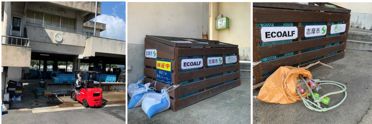
三重県志摩市に設置した安乗漁港内の海洋ゴミのストッカー

また、今年10月からは、三重県志摩市が主体となり三重外湾漁業協同組合安乗事業所の協力を得て、安乗漁港内にストッカーを設置し、漁業者の方に、漁の最中に網にかかったペットボトルをはじめとする海洋ゴミを陸に持ち帰っていただき、ストッカーに投入する実証実験を行っています。