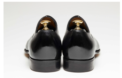
【シームレスヒール】

さらに、一般的な革靴では中央部分に継ぎ目を入れるものが多いなか、「匠」シリーズは継ぎ目のない「シームレスヒール」を採用しています。革を大きく裁断してふだんに使う必要があり、仕立てにも高い技術を要します。