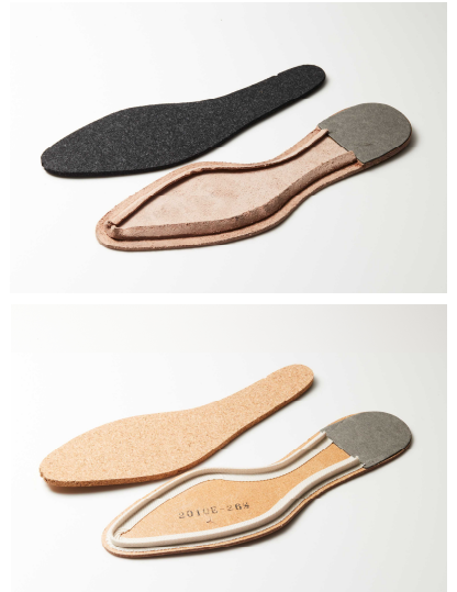
上：フレキシブルグッドイヤーウェルト製法 下：グッドイヤーウェルト製法

【匠の技 壹】 …… “フレキシブルグッドイヤーウェルト製法”が生む優れたしなやかさ 「匠」シリーズと通常ラインとの最も大きな違いは、底付けの製法にあります。ともに本格靴の王道であるグッドイヤーウェルト製法ですが、「匠」シリーズが用いるのは「フレキシブルグッドイヤーウェルト製法」という「三陽山長」独自の仕立てです。通常のグッドイヤーでは中底にリブテープとよばれる部品を貼り付け、そこにアッパーとの繋ぎ役になるウェルトを縫い付けていきます。対してフレキシブルグッドイヤーでは、中底の端をめくるようにして革を起こし、そこにウェルトを縫い付けます。このため「フレキシブルグッドイヤーウェルト製法」はリブテープという余計な部品を用いないぶん、底の屈曲性が格段にアップすることになります。この作業は、小刀のような道具を使って職人がひとつひとつ手で行っています。さらに、通常のグッドイヤーではクッション材としてコルクを仕込むところを、フレキシブルグッドイヤーではより柔軟なフェルト素材にすることで、さらなるしなやかさを実現。“堅牢さに優れたものの馴染むまでが硬い”というグッドイヤーの欠点を克服し、驚くほどの柔らかな履き心地を叶えました。