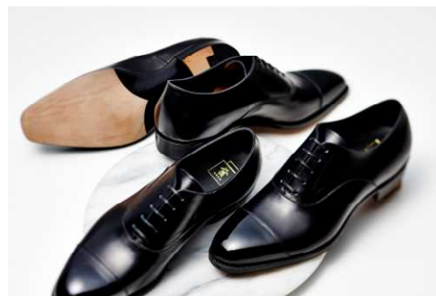
2019年より展開し好評の 『匠 友二郎』(手前右)、『匠 友之介』(手前左)

「三陽山長」においても、ブランドを代表するストレートチップの上位モデルとして2019年より展開している『匠 友二郎』と『匠 友之介』の売上が、コロナ禍にも関わらず2019年を上回る実績を残しています。こうしたことを背景に、今春はビジネススタイルの多様化に合わせてより幅広いスタイリングをお楽しみいただけるよう、ブランドの人気モデル『源四郎』と『弦六郎』の「匠」シリーズを発売することとしました。