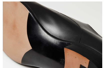
【セミベヴェルドウエスト】

紳士靴の優美さは、曲線と曲線の乱れなき連なりによって醸し出されます。「匠」シリーズではその曲線美をさらに追求。象徴的なのは、土踏まず周りに採用された「セミベヴェルドウエスト」仕立てです。一般的な靴よりもシェイプを絞り込み、抑揚をつけて仕上げています。これにより靴全体に曲線美が強調され、いっそう流麗な佇まいになります。これも職人の手仕事によるもので、世界の高級靴にも採用される意匠です。