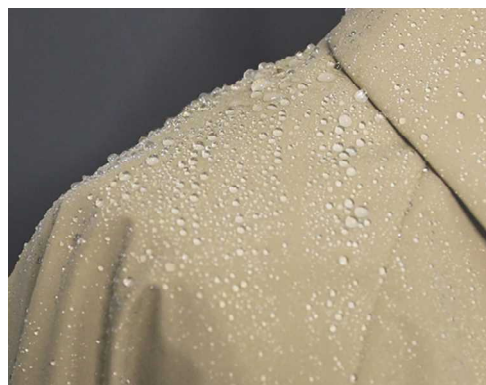
雨傘と同等の耐漏水性を実現（画像はイメージ）

トレンチコート及びステンカラーコートにおいては、50年以上コートをつくり続けてきた当社の自社工場であるコート専門工場「サノソーイング 青森ファクトリー」にて縫製しています。