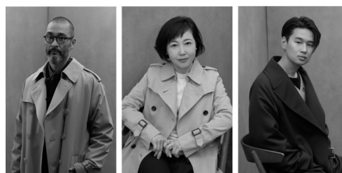
「SANYOCOAT」イメージビジュアル

twitter https://twitter.com/sanyoessentials