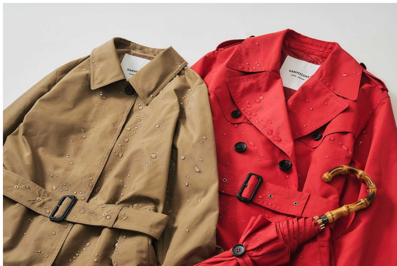
雨傘の試験基準をクリアした女性向け「アンブレラコート」

コートの開発にあたっては素材の選定やデザイン面で国内洋傘老舗メーカー・ムーンバット社のオリジナルブランド「HANWAY（ハンウェイ）」とコラボレーションし、共同開発によりコートとのコーディネートを楽しむことができる「アンブレラコート」と同素材の雨傘も発売いたします。