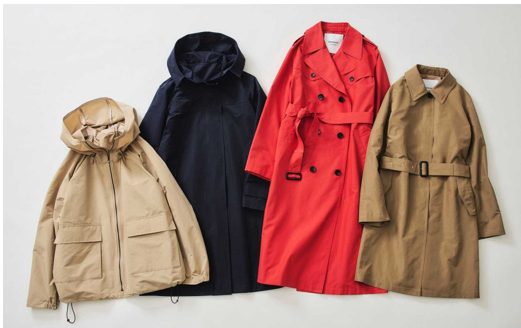
「アンブレラコート」

コートの開発にあたっては素材の選定やデザイン面で国内洋傘老舗メーカー・ムーンバット社のオリジナルブランド「ハンウェイ」とコラボレーションし、共同開発によりコートとのコーディネートを楽しむことができる「アンブレラコート」と同素材の雨傘も発売いたします。