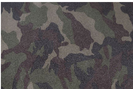
ウッドランドパターンを採用