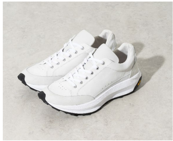
トURREザー、トゥ、タン、ヒール、サイド、ロゴシール、ソール、靴紐の計 8 か所のカスタマイズが可能