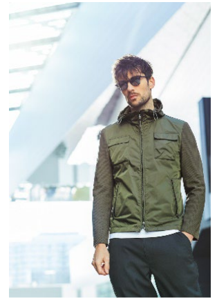
2022年春夏 「EPOCA UOMO」ビジュアル

https://www.instagram.com/epocauomo_official/