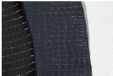
左からブラック、ネイビー、ホワイト