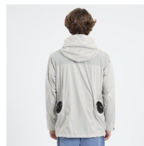
両脇の腰部分にファンを装備

空調服®との共同開発にあたり、独自の適合テストをクリアしたはっ水性のあるポリエステル高密度タフ素材を採用。動作が多い肩の切り替えやファンを取り付ける部分には耐久性の高いコーデュロナイロンを使用しました。