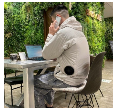
リモートワーク時でも着用しやすいパーカーとベストの2型を開発

コロナ対策のための会食や移動制限の緩和による経済活動が再開するとともに、脱炭素の流れを受けた火力発電の廃止などを背景に、今夏の電力需要ひっ迫に備えるため、7年ぶりに全国規模での節電が要請されています。コロナをきっかけにリモートワークが定着しつつある中で、オフィス内で集まって勤務するスタイルが主流だったこれまでに比べて、気温が上昇するこれからの季節は個々の自宅で勤務してエアコンを使用することでCO2の排出量や電気代の増加が懸念されていることから、エアコンに比べて排熱やCO2の排出量が非常に少ない「空調服®」のシステムを採用し、リモートワーク時などでも着用しやすい商品を開発することとしました。