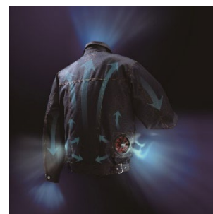
小型ファンで風の流れをつくり、汗の気化を促進する「空調服®」

■「空調服®」について： https://www.9229.co.jp/about/about_index