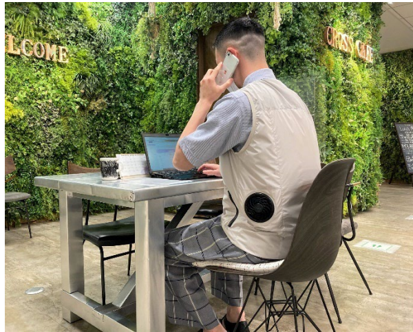
「空調服®」のシステムを採用した小型ファン付きのベスト

三陽商会が展開するブランド「MACKINTOSH PHILOSOPHY（マッキントッシュ フィロソフィー）」メンズは株式会社空調服が展開するファン付ウェア「空調服®」とコラボレーションし、ファッション性と機能性を融合したハイブリッドカテゴリ「britec（ブリティック）」シリーズのアイテムとして、小型ファン付きのマウンテンパーカー・ベスト全2型を6月15日（水）に全国百貨店・商業施設および当社直営オンラインストア「サンヨー・アイストア」（ https://sanyo-i.jp/s/ ）にて一斉発売いたします。 冷房が使用できない作業現場などで用いられる小型ファン付きのウェアを普段着として着用できる仕様にデザイン。 政府から節電要請がされるなか、室内のリモートワーク時などに着用してエアコンの使用を抑えることで、電力・CO2 削減に貢献するサステナブルなクールビズ商品として訴求いたします。