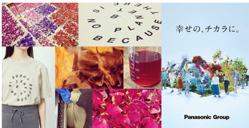
パナソニックグループの企業CMで用いた生花を染料として活用