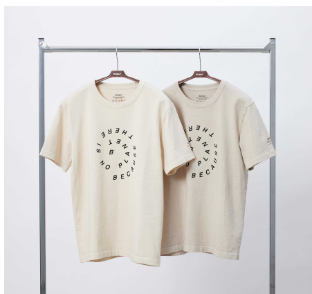
「ECOALF ボタニカル ワンハンドレッド Tシャツ」