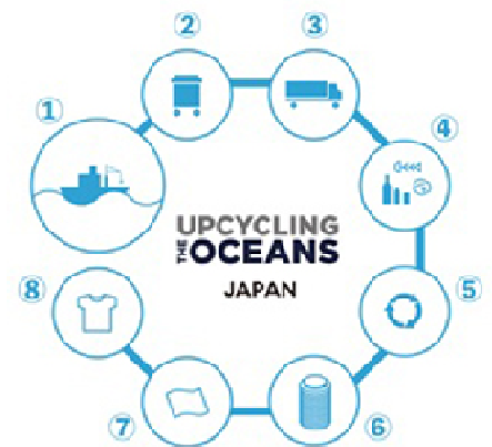
「UPCYCLING THE OCEANS」の仕組み

また、海洋ゴミを回収し新たな製品に活用するプロジェクト「UPCYCLING THE OCEANS」を推進するなど、“地球環境を守るために服をつくる”という新しい発想のエコサイクル型ファッションブランドで、特にSDGsの14番“海の豊かさを守ろう”に繋がる活動に重きを置いてブランド運営をしています。