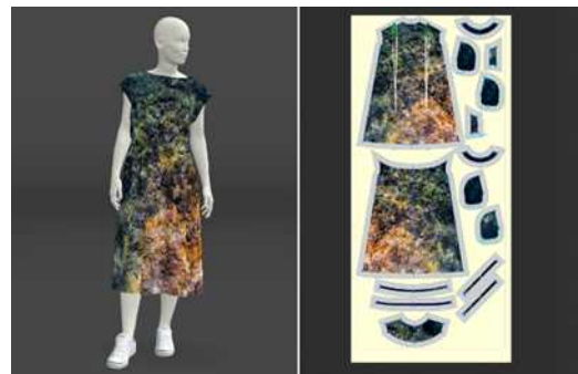
試作品レス、在庫レスを実現する アパレルシミュレーションソフト

本取り組みに採用されているアベイルが展開する「VStitcher(ブイステッチャー)」は、2Dの型紙データから3Dサンプルの構築を可能とするアパレル向けシミュレーションソフトです。身長や体形を設定したアバターを通して3Dのリアルな着装イメージを表示させ、着装イメージ画面上にて丈等を調整した場合は、プリント柄を含めた3Dデジタルデータは2Dの型紙データに反映されるため、型紙の形も入ったプリントデータと