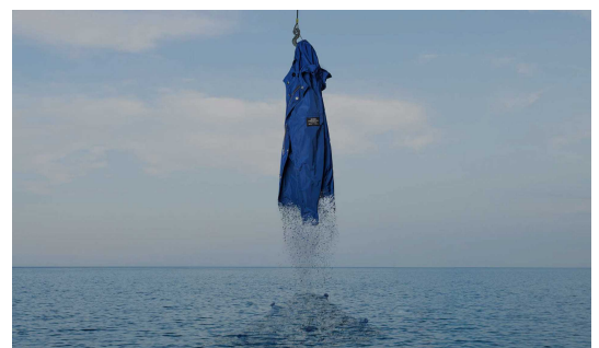
「ECOALF」イメージビジュアル

Facebook https://www.facebook.com/ecoalfjapan/