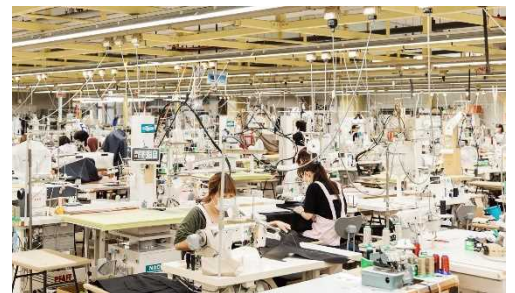
サンヨーソーイング 青森ファクトリー

当社子会社。2023 年に設立 80 周年を迎えた当社の祖業アイテムでもあるコートの生産を手がける、コート専門 54 年（1969 年創立）の工場で、当社のものでの根幹ともいえる国内工場です。工程数の多いコートを正確に縫製し仕上げる技術は、当社製品の生産に加えて、近年ではセレクトショップなど他のアパレルメーカーからも多くの受注を受け、中でも綿のギャバジン素材によるトレンチコートの生産技術については高い評価をいただいております。