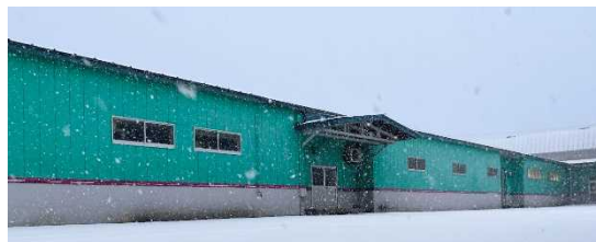
コート生産のエキスパートとして総合力を高める 「サンヨーソーイング 青森ファクトリー」

『青森ダウン』は、トレンチコートの生産で培ってきた職人技術と最新の設備投入を掛け合わせて作り上げた「SANYOCOAT」のものづくりの DNA を盛り込んだ新たなダウンコートです。