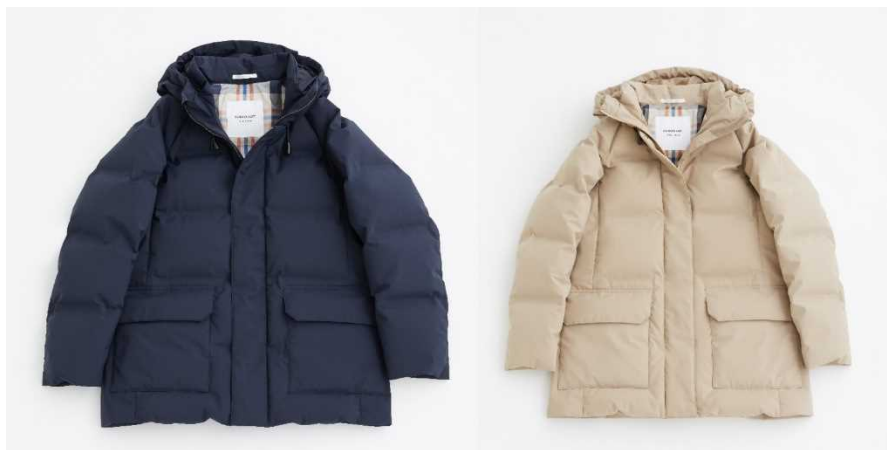
コート専門ブランド「サンヨーコート」が新たに提案するダウンコート SANYOCOAT 『青森ダウン』