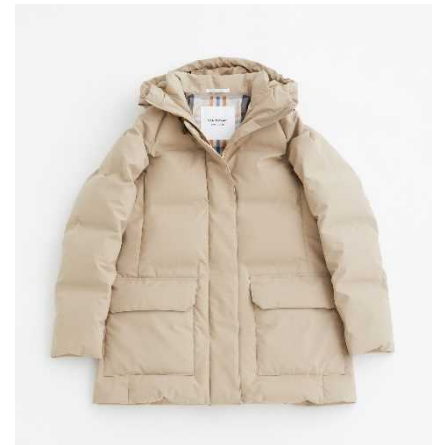
上品な装いにも合わせやすい『青森ダウン』

デザインは、 ジャケットの上から羽織っても美しい着丈、シルエットを追求し、ダウンパックの段数やダウンの量も試行錯誤を重ね上品に仕上げています。「熱圧着」の無縫製技術を駆使することで縫い目を極力減らしたことも上品な雰囲気を出す上でポイントになっています。悪天候の日にはフード部分のストラップによりフードの形を調整して着用することができます。カジュアルなスタイルだけでなく、上品な装いにも合わせやすく、雨や雪の日など幅広く活用できるダウンコートです。