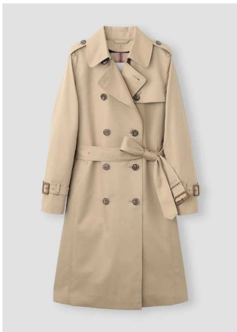
「MACKINTOSH PHILOSOPHY」 RIDALトレンチコート (96cm丈)

ブランド：「MACKINTOSH PHILOSOPHY (マッキントッシュ フィロソフィー)」