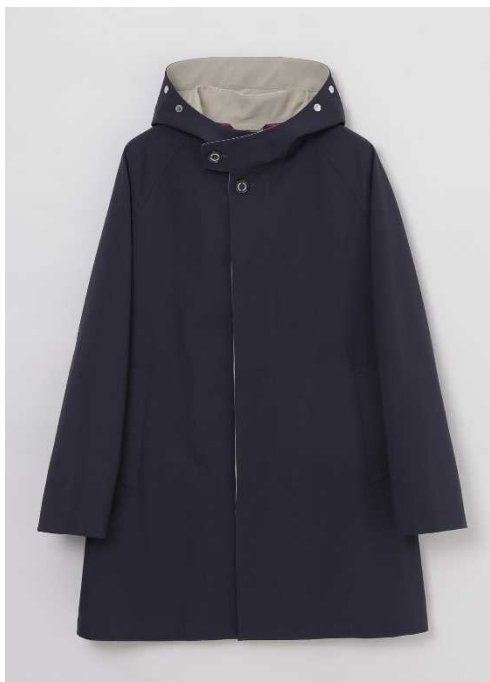
「MACKINTOSH PHILOSOPHY」 TIVERTON HOOD フーデッドコート

ブランド：「MACKINTOSH PHILOSOPHY (マッキントッシュ フィロソフィー)」