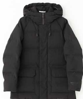
メンズ (ショート丈、ミドル丈)