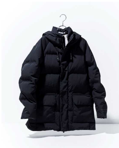
新色ブラックは、上質感のある深い黒を実現した当社独自の「BLACK OF BLACKs」(写真：メンズ)

表の生地が優れたはっ水性を発揮。もし水が染み込んでしまっても、中央の薄い膜が水分を通しません。一方、マイクロ単位の無数の穴を持った特殊多層構造膜が湿気や熱気を排出し、従来の透湿素材にはないハイレベルな通気性を発揮します。着心地はしなやかで軽く通気性に優れ、動き続けてもほとんど蒸れない、ハードなアクティビティにも適するほどの機能素材。衣服内環境を快適にキープします。