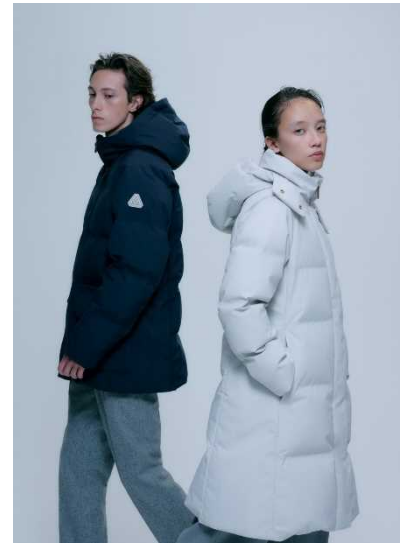
上品な装いにも合わせやすい『青森ダウン』