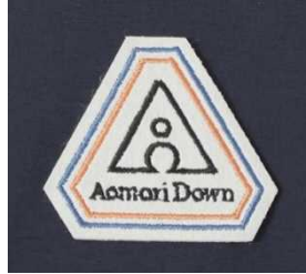
左腕のエンブレム 青森の“ A ”、雪だるまがモチーフ

なお、定番シリーズ化を図るため、新たに『青森ダウン』のエンブレムを作製し、2024年冬モデルより左腕にポイントとして付けています。エンブレムのデザインは、青森の頭文字である“ A ”、雪国青森をイメージした雪だるま、『100年コート』などの裏地に用いるオリジナルのチェック柄「三陽格子」にあるオレンジとブルーのカラーを用いてデザインしたものです。