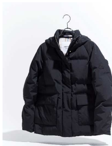
新色ブラックは、上質感のある深い黒を実現した当社独自の 「BLACK OF BLACKs」(写真:ウイメンズ)