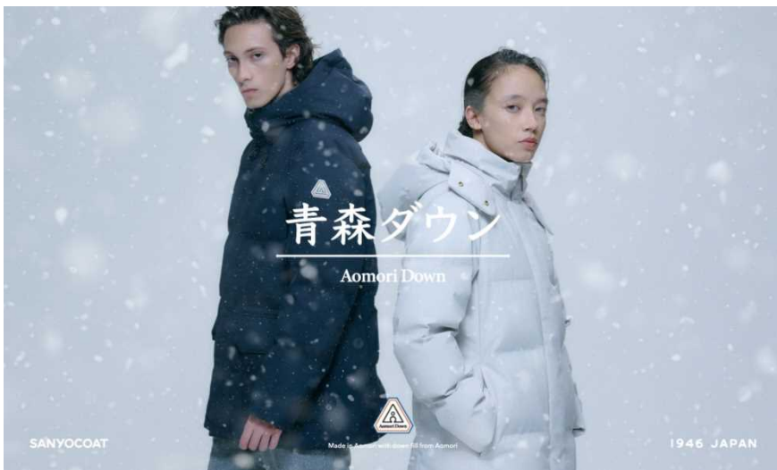
コート専門ブランド「サンヨーコート」がダウンコートの最高峰を目指し開発 SANYOCOAT『青森ダウン』

(※1) https://prtimes.jp/main/html/rd/p/000000668.000009154.html