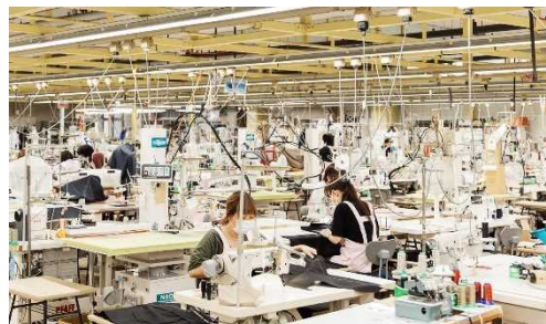
サンヨーソーイング 青森ファクトリー

直近の動向 ：2021年2月、複数の設備投入をおこない新たにR&D機能を持たせることで、近年の需要に即した生産体制を確立。ダウンコート生産の内製化や新アイテムの開発など、トレンチコートに留まらない製品の生産に取り組んでいます。