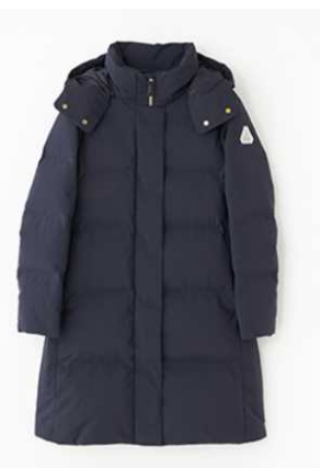
ウイメンズ (ミドル丈、ロング丈)