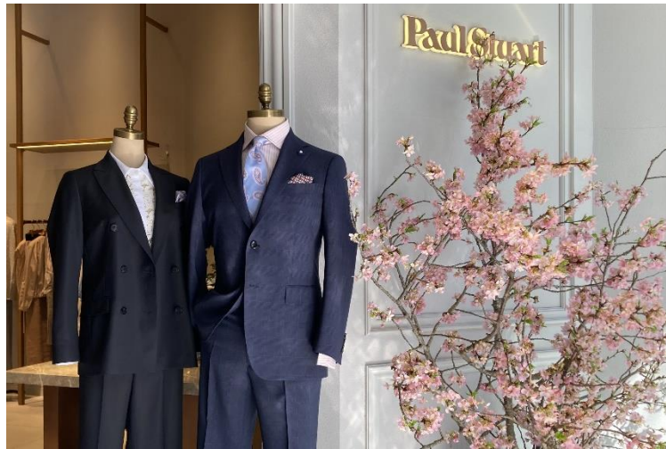
「Paul Stuart」2025年春の特別企画商品 (左：婦人セットアップ、右：紳士スーツ)

三陽商会が展開する「Paul Stuart（ポール・スチュアート）」は、社会貢献に向けたサステナビリティ活動の一環として、一般社団法人 LOOM NIPPON（以下、ルームニッポン）が東日本大震災の被害を受けた宮城県南三陸町の地に桜の植樹活動が続ける「SAKURA PROJECT」（以下、桜プロジェクト）に賛同し、継続的に支援しています。2014年以降、毎年桜をテーマにした共同企画を通して「桜プロジェクト」を支援しており、12年目となる2025年春は、特別企画商品として、パタゴニアウールのトレーサブルな服地等を使用した上質なスーツやセットアップを販売し、売上の一部を桜の植樹活動に寄付いたします。