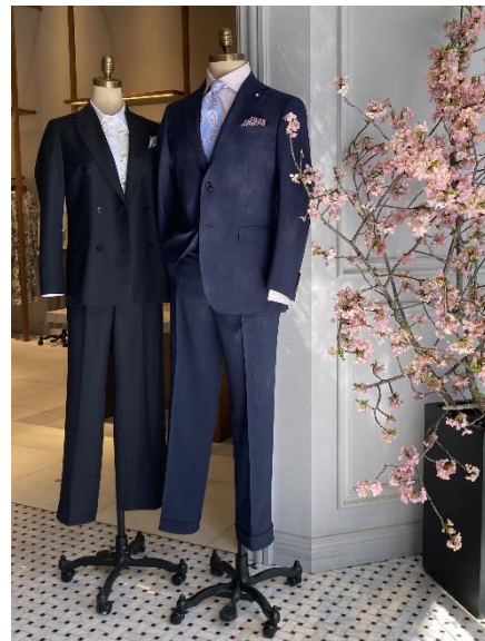
Paul Stuart 青山本店のエントランスに桜の装花と共にディスプレイした特別企画商品

2025年春は、特別企画商品として、パタゴニアウールのトレーサブルな服地等を使用した上質な紳士スーツや婦人セットアップを販売します。