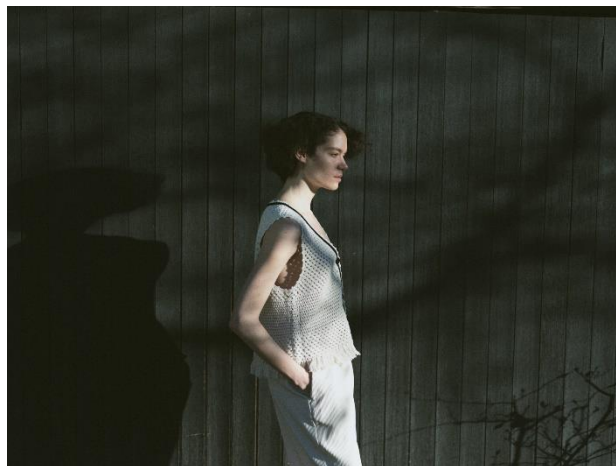
新ブランド「BIANCA」 2025年春夏ビジュアル