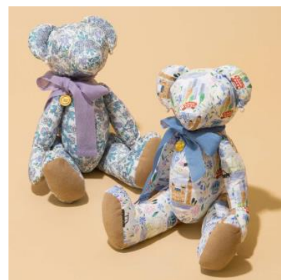
プレゼントのオリジナルベア