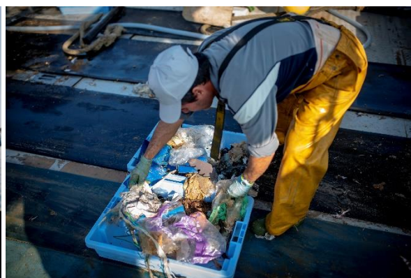
海洋ゴミを回収し新たな製品に活用するプロジェクト「UPCYCLING THE OCEANS」の様子