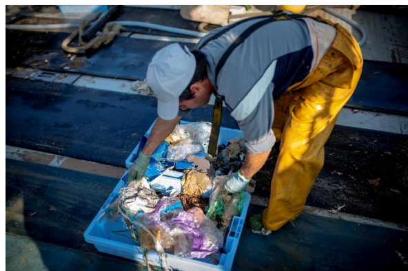
海洋ゴミを回収し新たな製品に活用するプロジェクト「UPCYCLING THE OCEANS」の様子