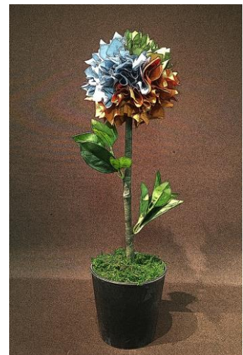
出来上がりのイメージ(高さ約40cm)

母の日のプレゼントとして大切なお母さまをイメージしてつくったり、ご自分の部屋に飾ることをイメージしてつくったりと、目的によっていろんな一輪の花をつくることのできるワークショップです。