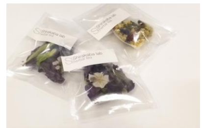
オリジナル・ハーブブレンドティー

国産、農薬、化学肥料不使用にこだわった北海道のハーブブランド、Shirakaba lab のコンセプトに共鳴し、マロウから抽出したやさしいパープルとさわやかなグリーンのカラーに合わせた2色のマロウブレンドと、初夏をイメージした柑橘系のオリジナル・ハーブブレンドをコラボレーションしました。