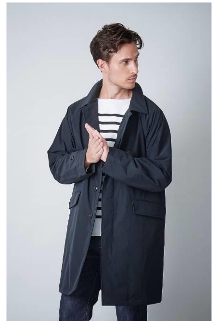
(ヒーティア パルマカーンコート)