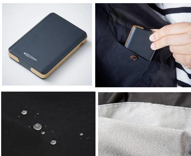
↑（写真上）付属のモバイルバッテリー。取り外し可能で、外せばコート本体のクリーニングが可能。 （写真下）表地には雨水をはじくはっ水性の生地を採用。雨の日にも着用可能です。中布には「コマサーモ」を使用。衣服内の湿気がコマサーモに到達すると2℃発熱する特殊な素材で保温性を高めます。