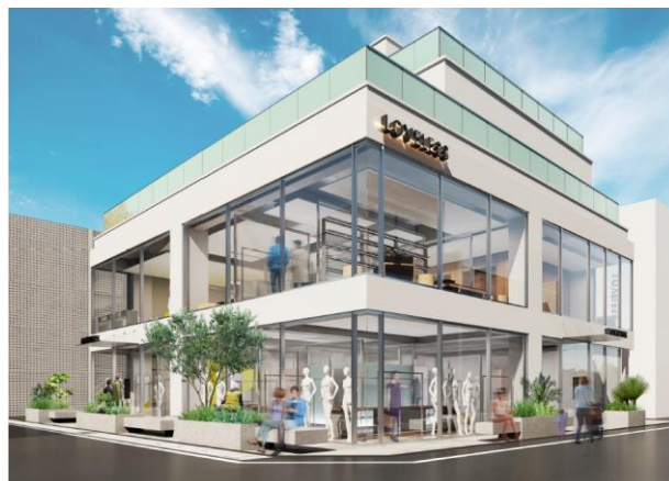
11/30(土)移設・リモデルオープンする旗艦店「LOVELESS青山」 外観イメージ