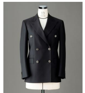
(2019年12月に加わったダブルJK)

これまでのジャケットスタイル (テーラード/シングル、ダブルとノーカラー) に 2019年12月よりメンズライクな仕立てのダブルジャケットを追加しています。