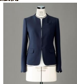
（新たに追加するラウンドカラー）

1月に入ると、冬物セールが並ぶ中でも春を見越してセレモニースーツを下見するお客さまも多くなり、例年1月から2月にかけてセレモニーに着用できるジャケットスタイルへのニーズが高まることから、当ブランドではこれまでのビジネスシーンに向けたジャケットスタイル4種類に加え、セレモニースタイルとして新たにやわらかい雰囲気をもつラウンドカラーのパターンを追加。素材もセレモニーシーンを想定し、シルク混の光沢があるネイビーやウオッシュブル機能をもつストレッチ素材を中心に幅広く展開します。