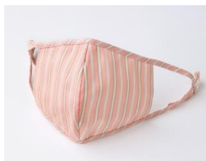
【オルタネートストライプコットンマスク】