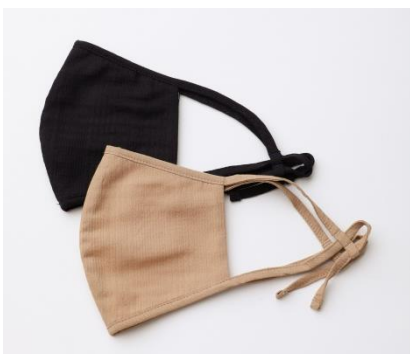
【グレンチェックコットンマスク】