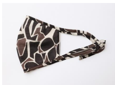
【アフリカングラフィックコットンマスク】