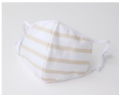
【ラメボーダーマスク】