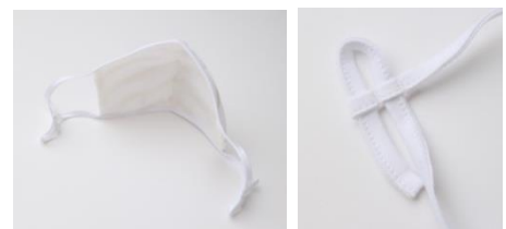
（写真左）立体裁断で顔を包み込むような設計。

（※2頁目「社内アンケート」参照） 国内工場 での厳しい品質管理の下生産しており、布製のため 繰り返し洗って使用 できます。表地には洋服に使われる 様々な色や柄の生地 を、裏地には 抗菌防臭ダブルガーゼ を使用。一部の表地では 吸水速乾性やUVカット機能 のある素材を使用し、日差しが気になるこの時期にお勧めです。