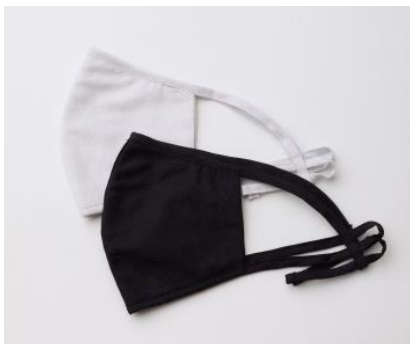
【フラワーカットジャカードコットンマスク】