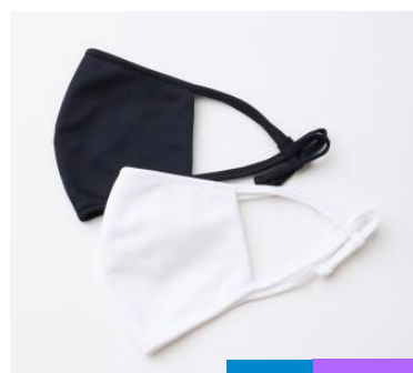
【吸水速乾・UVカット / ライトウエイ トカノマスク】