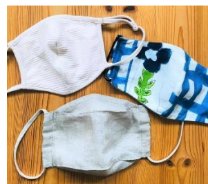
製作するマスクのイメージ

※8月1日(土)はオンラインでの開催となります。本部スタッフは新型コロナウイルス感染症への対策として、換気、消毒、ソーシャルディスタンスに取り組めます。