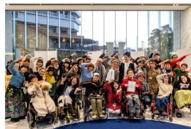
『みなとコオフク塾』 株式会社ワールド

売り場での服の試着を通して、障がいがある人が感じる服の困りごとを発見。(2019年秋開催)