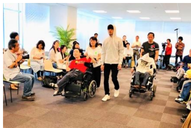
『シンコオフクジユク』 株式会社三陽商会

衣服だけでなく、接客サービス、ストアデザインまでを皆で考えてリデザイン。(2018年秋開催)