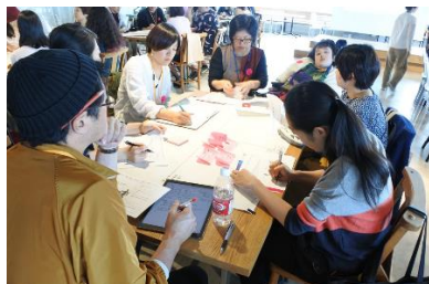
『コオフク塾 in シブヤ』 株式会社アダストリア

衣服だけでなく、接客サービス、ストアデザインまでを皆で考えてリデザイン。(2018年秋開催)